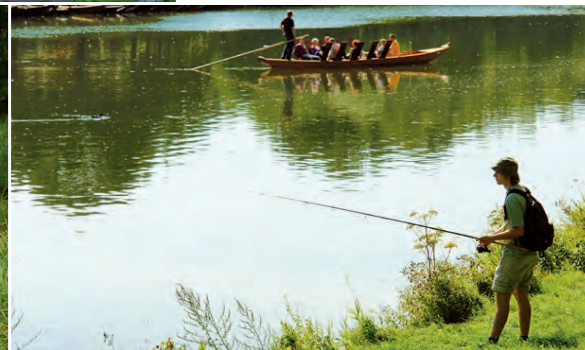
In Tübingen sieht man die typischen Stocherkähne. Der Neckar ist hier ein idyllischer kleiner Fluss.