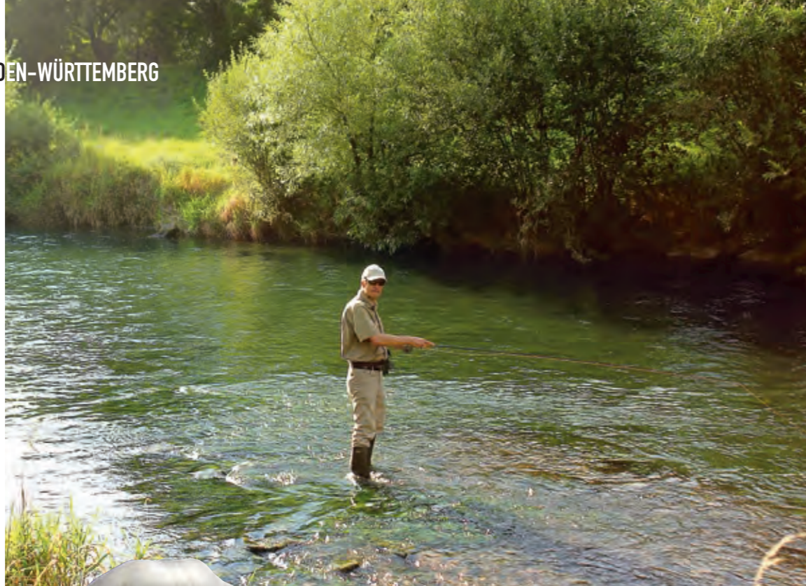
Ja, auch das ist der Neckar. Hier bei Sulz ist der große Strom noch ein kleiner Bach, in dem schöne Bachforellen ihre Heimat haben.