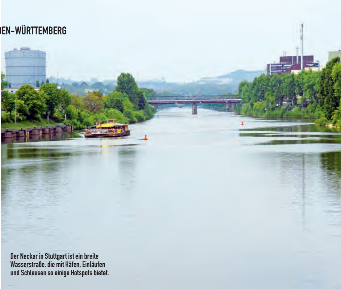
Der Neckar in Stuttgart ist eine breite Wasserstraße, die mit Häfen, Einläufen und Schleusen so einige Hotspots bietet.

Erwähnt werden muss hier auch der Hafen in Stuttgart Bad-Cannstatt. Hauptsächlich bei Hochwasser ziehen hier viele Fischarten hinein. Der Kraftwerkskanal neben dem Inselbad ist eine grüne Idylle. Schade, dass er schon nach einigen hundert fängigen Metern wieder in den Hauptstrom mündet. Die Zanderspezialisten kommen vor allem an der Hofener Schleuse auf ihre Kosten und auch die Schleuse in Aldingen verspricht stattliche Fänge. Welse werden von den Experten hauptsächlich mit Twistern und Blinkern gefangen. Die größeren Exemplare gehen aber