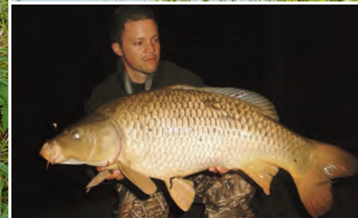
Ab Stuttgart flussaufwärts gibt es weiterhin tolle Karpfen. Diese Strecke war nie vom Karpfensterben berührt.