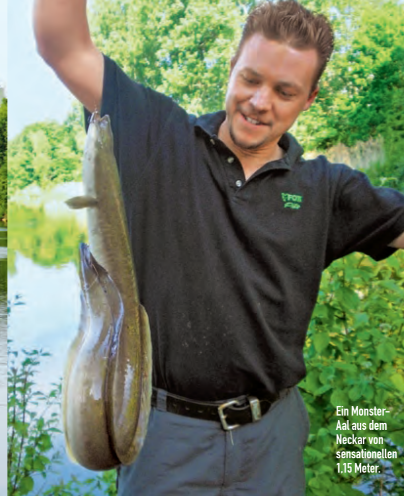
Ein Monster-Aal aus dem Neckar von sensationellen 1,15 Meter.