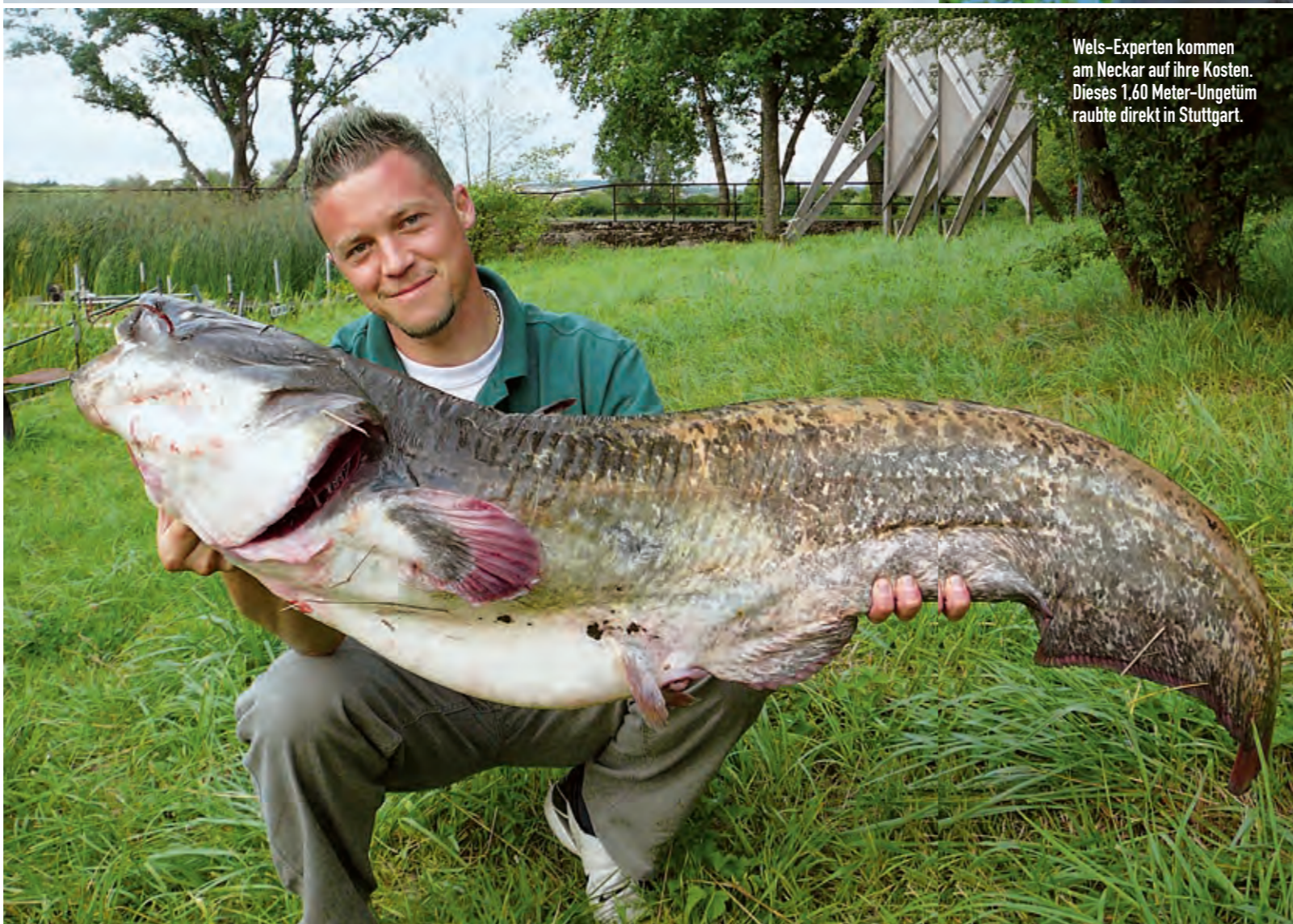
Wels-Experten kommen am Neckar auf ihre Kosten. Dieses 1,60 Meter-Ungetüm raubte direkt in Stuttgart.